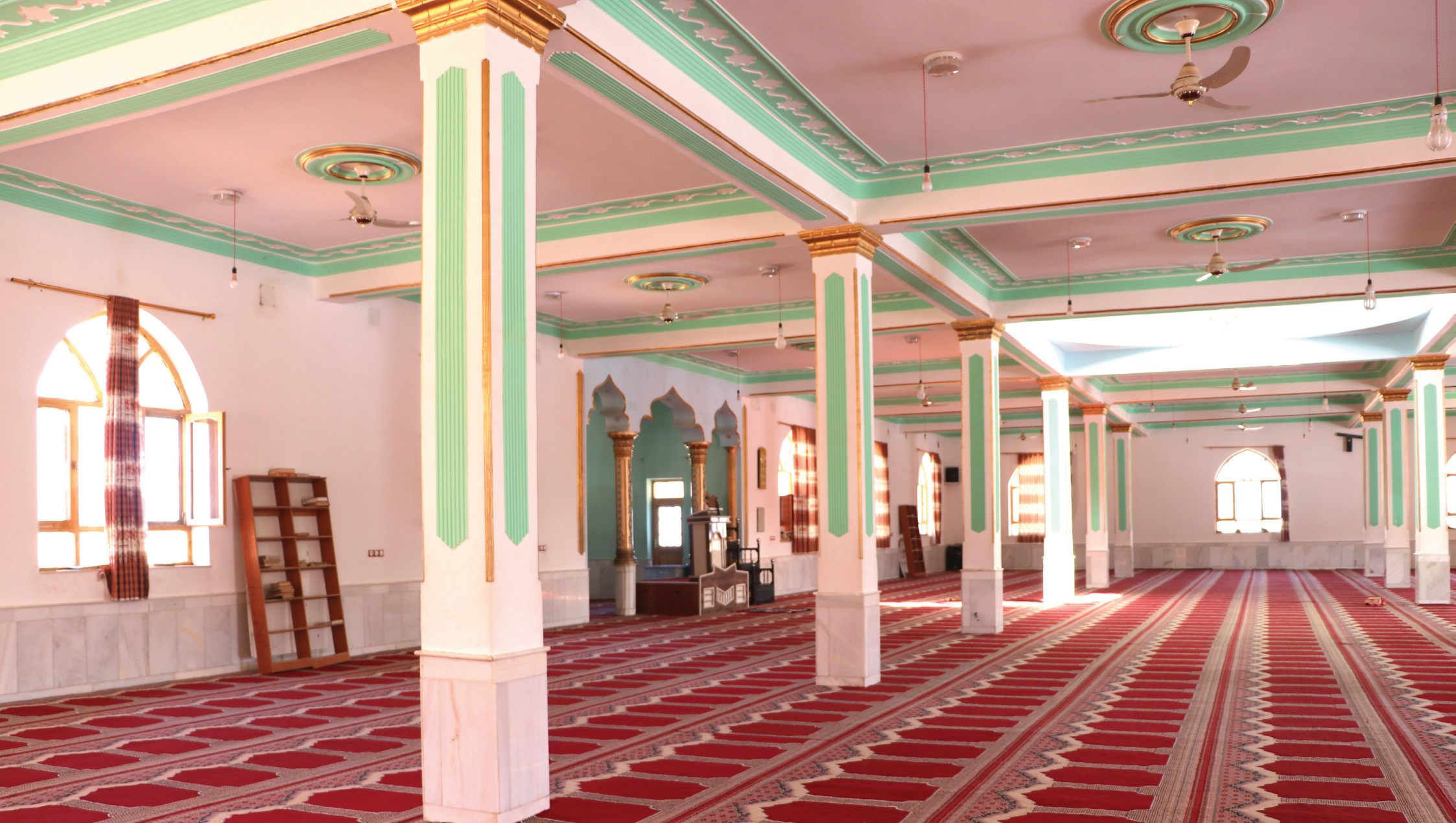
Ashraf Abad Mosque

2 This Mosque was built in 1000 square meter in the fifth district of Farah city that can contains 2000 prayers at the same time. Ashraf abad Mosque includes 2 Minarates, 1 dome and an ablution place. The construction of the Central mosque finished at 13-12-2014.