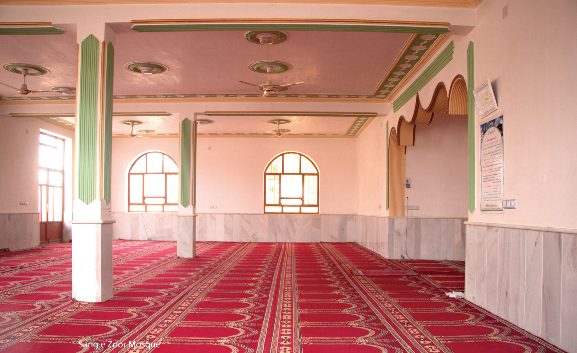
Sang e Zoor Mosque

16 This Mosque was built in 273 square meter in Sang e Zoor village of Farah city that can contains 400 prayers at the same time. This Mosque includes 1 Minarates, 3 Toilet, Septic tank and ablution place. The construction of the mosque finished at 15-07-2017.