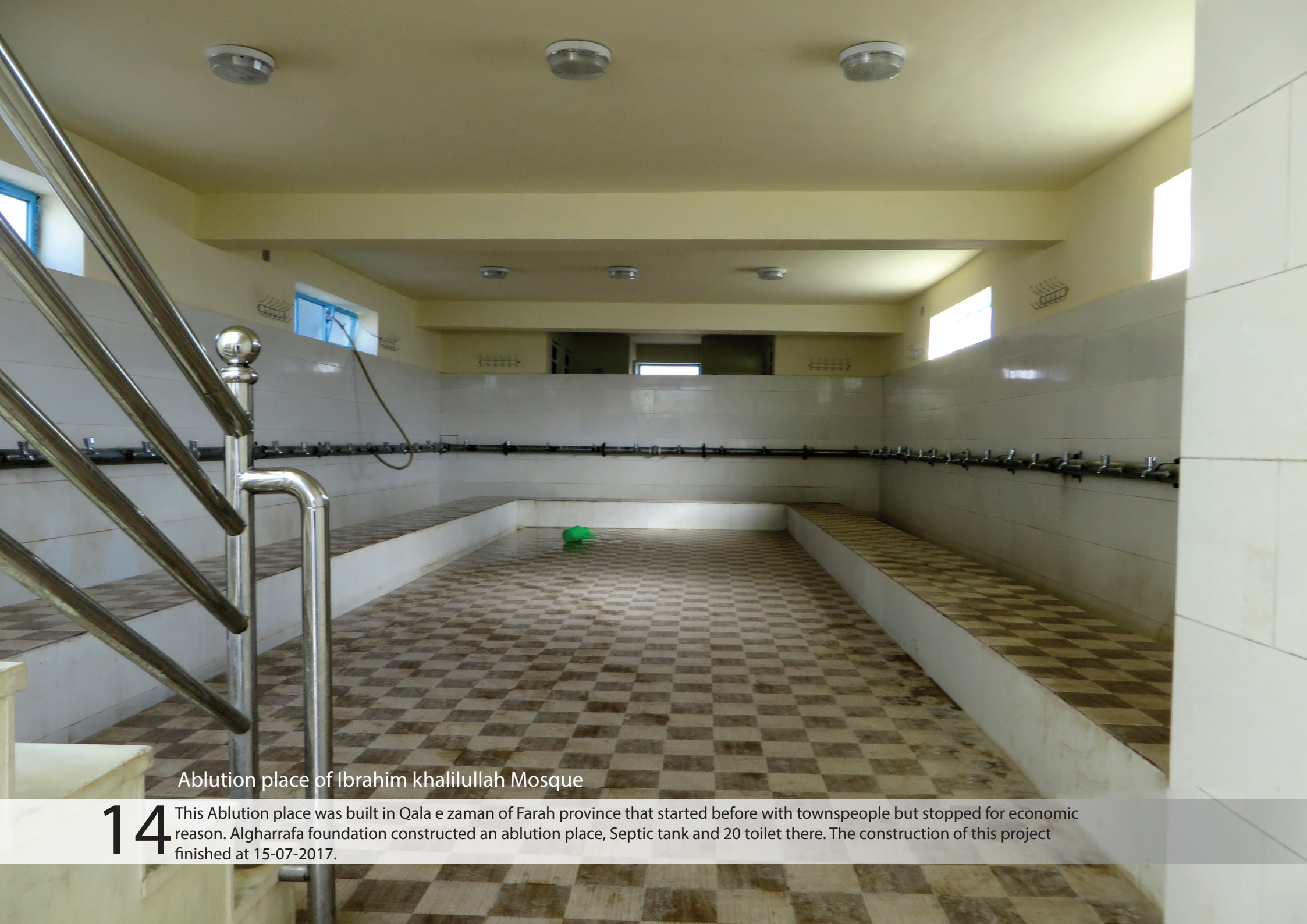
Ablution place of Ibrahim khalilullah Mosque

14 This Ablution place was built in Qala e zaman of Farah province that started before with townspeople but stopped for economic reason. Algharrafa foundation constructed an ablution place, Septic tank and 20 toilet there. The construction of this project finished at 15-07-2017.