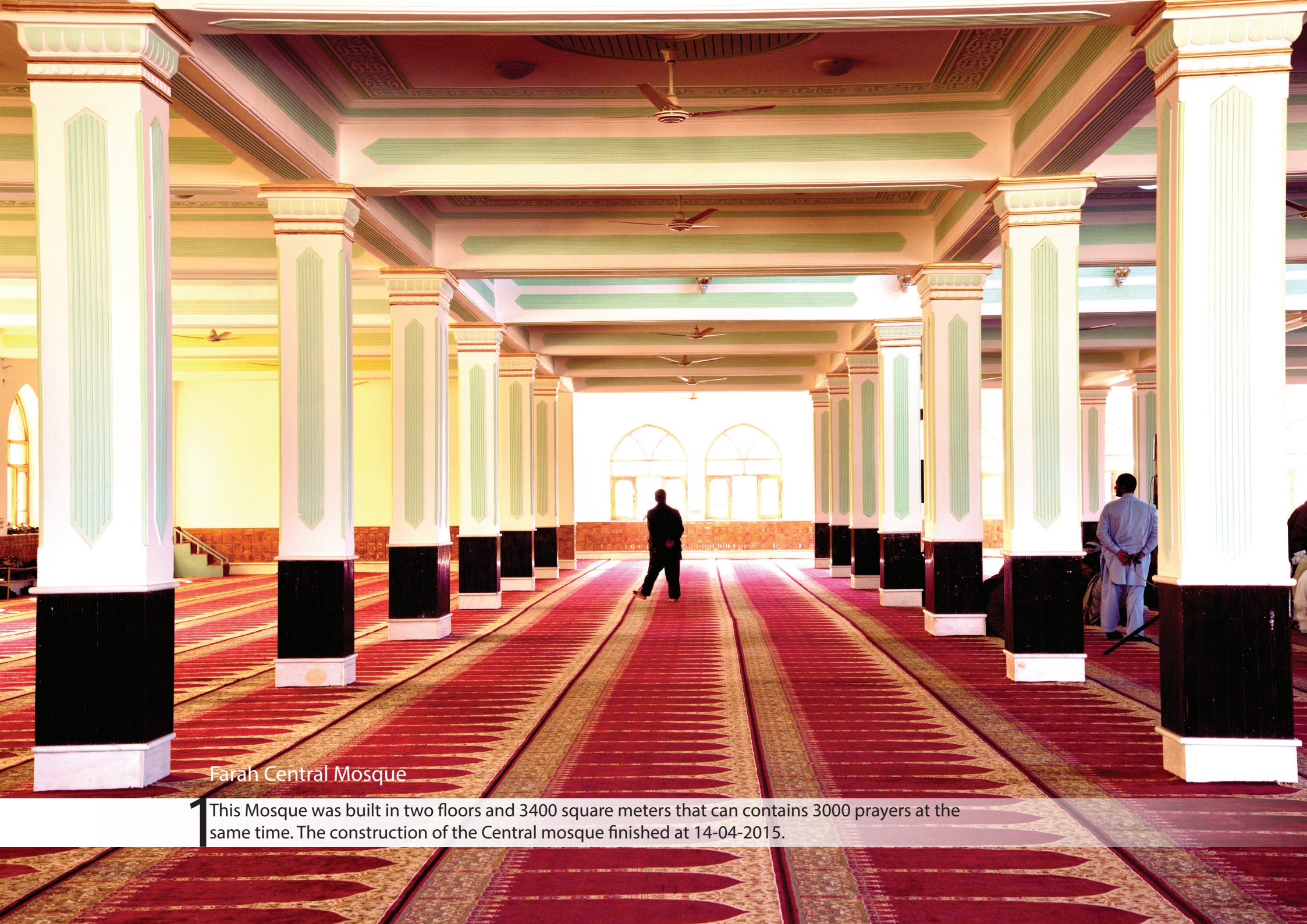
Farah Central Mosque

This Mosque was built in two floors and 3400 square meters that can contains 3000 prayers at the same time. The construction of the Central mosque finished at 14-04-2015.