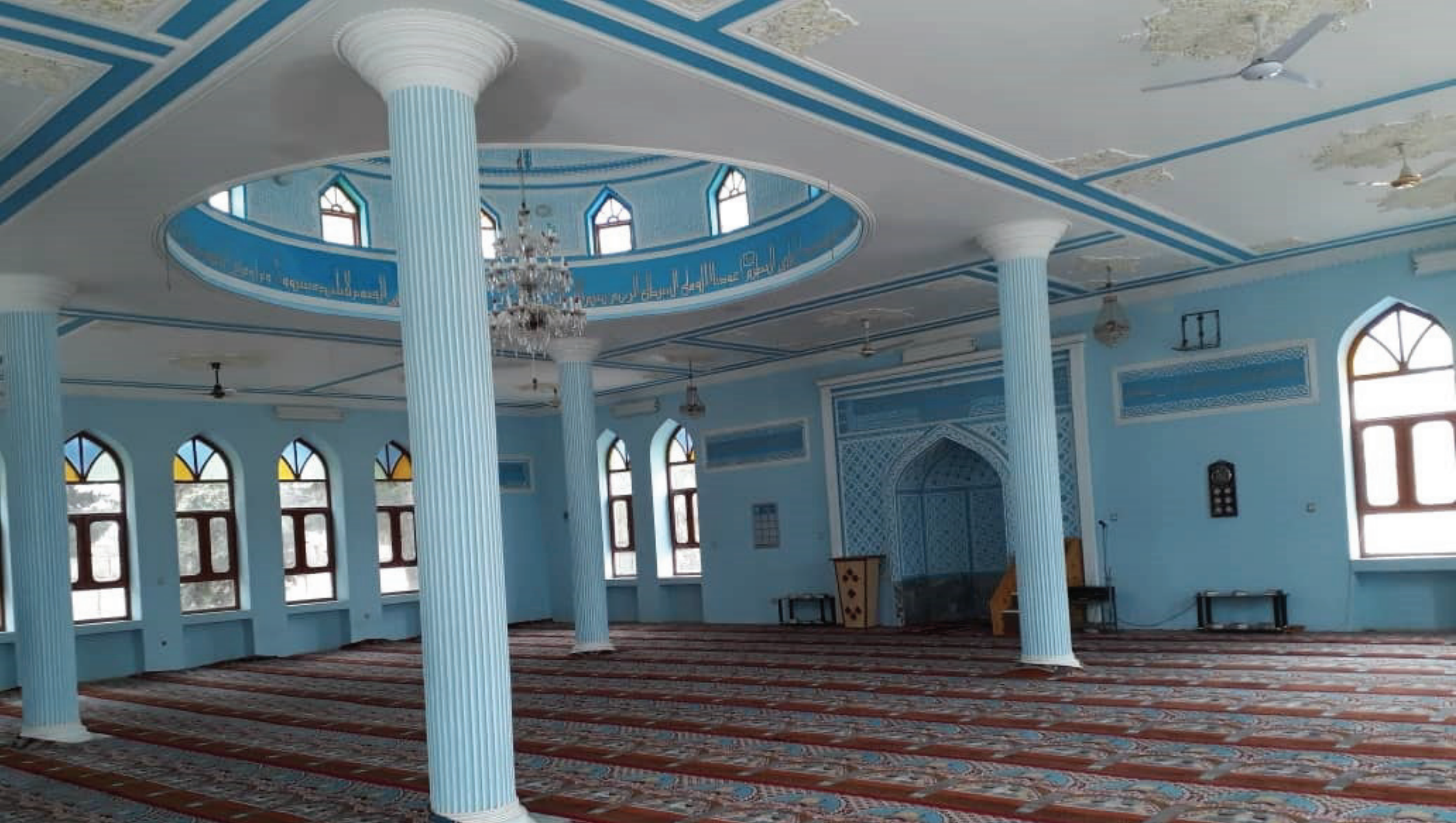
Herat Airport Mosque