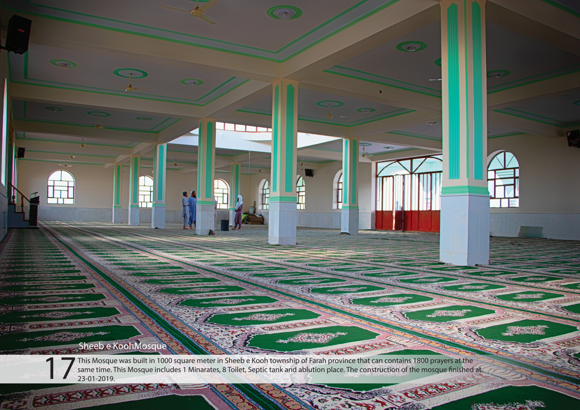
Sheeb e Kooh Mosque