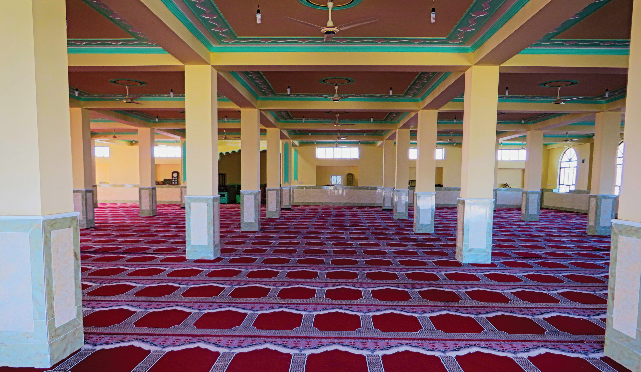
Lash & Jovin Mosque