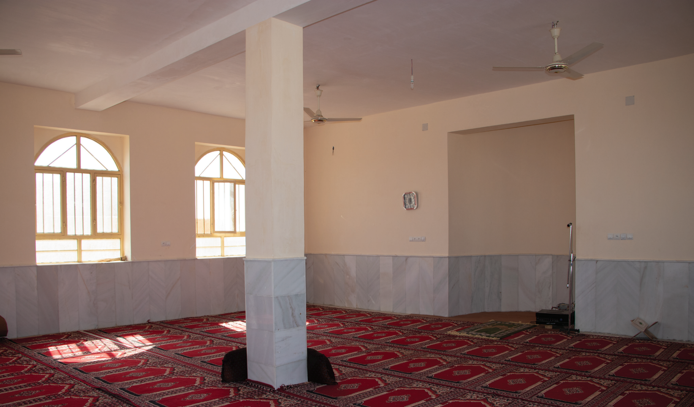
Kooh e Taka Mosque

10 Algharrafa foundation for request of The People of Kooh e Taka village decided to make a Mosque in this area.