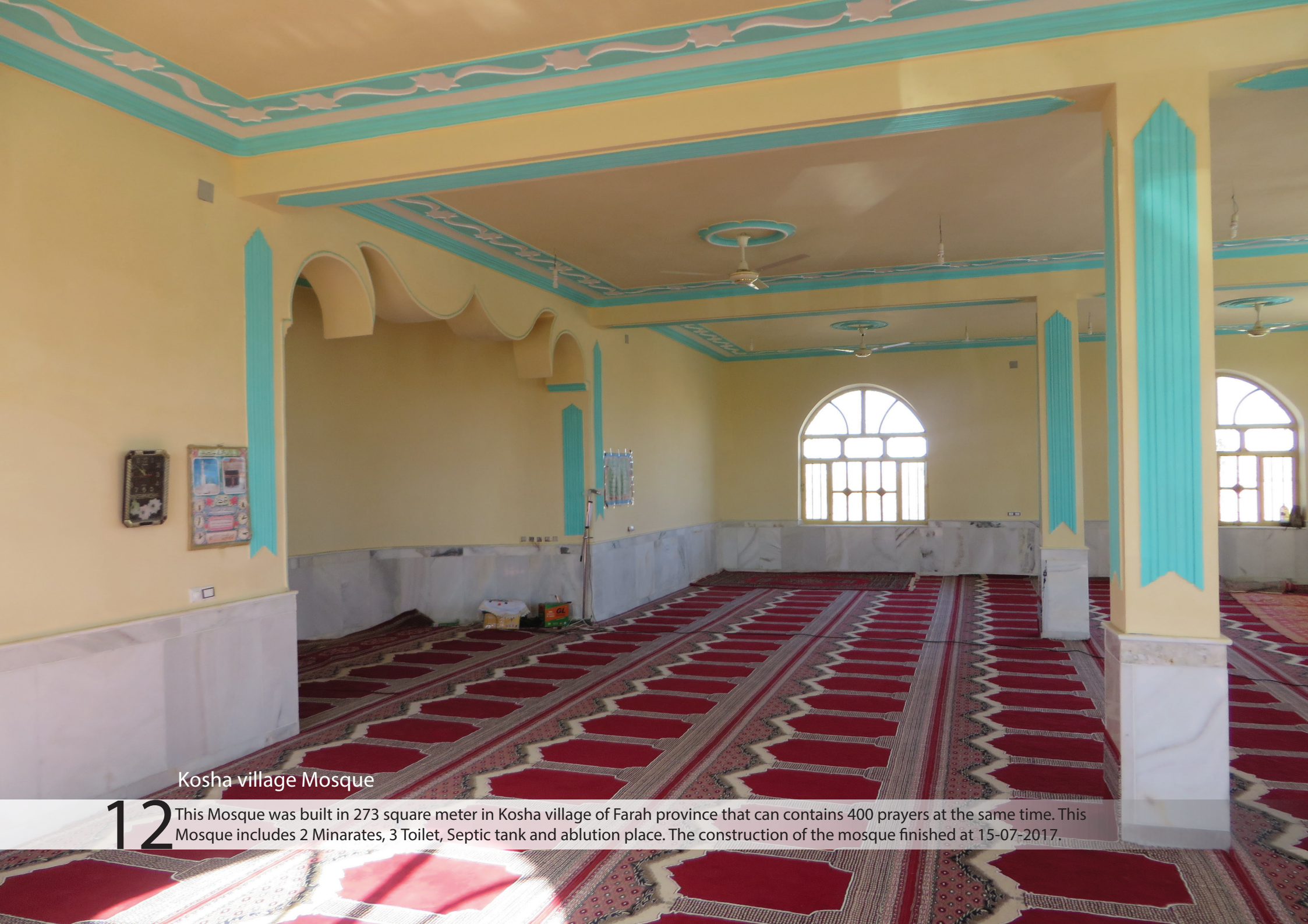
Kosha village Mosque

12 This Mosque was built in 273 square meter in Kosha village of Farah province that can contains 400 prayers at the same time. This Mosque includes 2 Minarates, 3 Toilet, Septic tank and ablution place. The construction of the mosque finished at 15-07-2017.