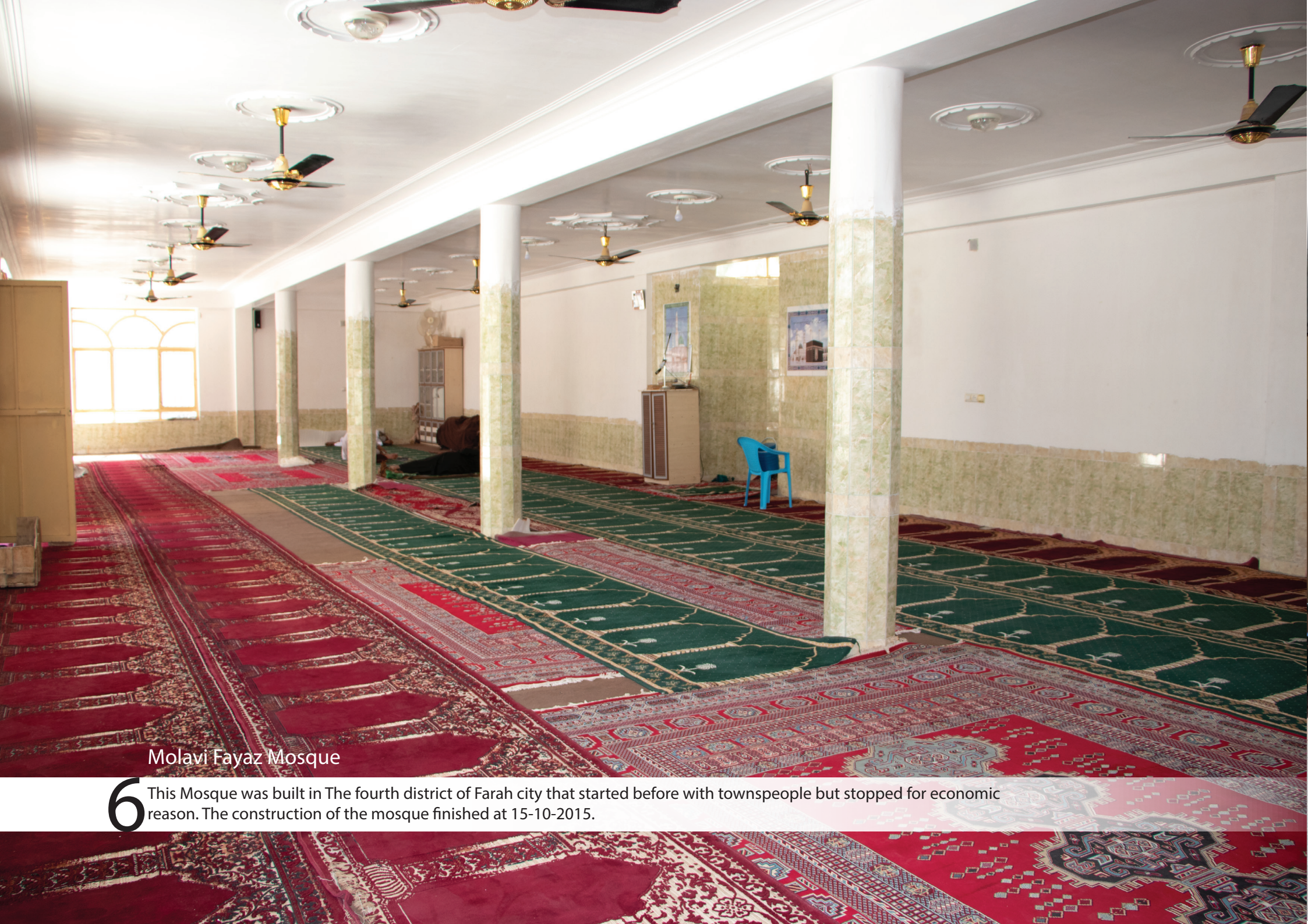
Molavi Fayaz Mosque

6 This Mosque was built in The fourth district of Farah city that started before with townspeople but stopped for economic reason. The construction of the mosque finished at 15-10-2015.