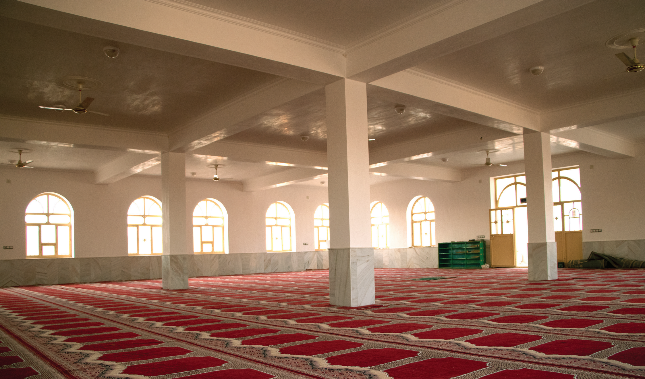
Twesk e Paen Mosque

7 This Mosque was built in 455 square meter in Twesk e Paen of Farah city that can contains 800 prayers at the same time. Twesk e Paen Mosque includes 1 Minarates and an ablution place. The construction of the mosque finished at 11-10-2016.