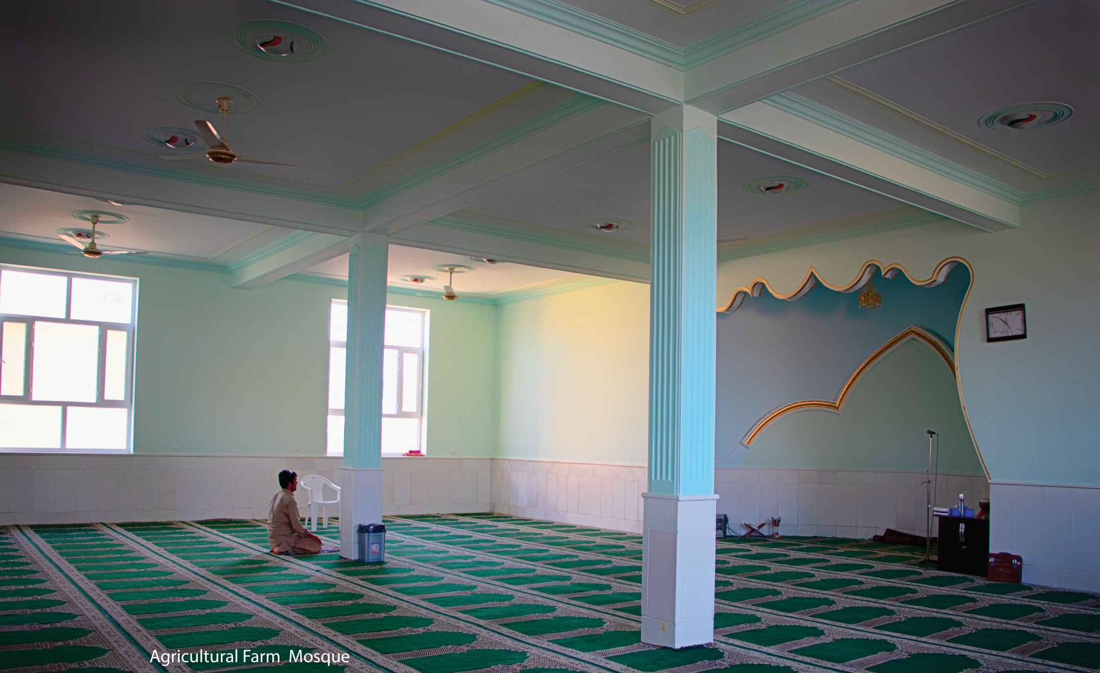
Agricultural Farm Mosque