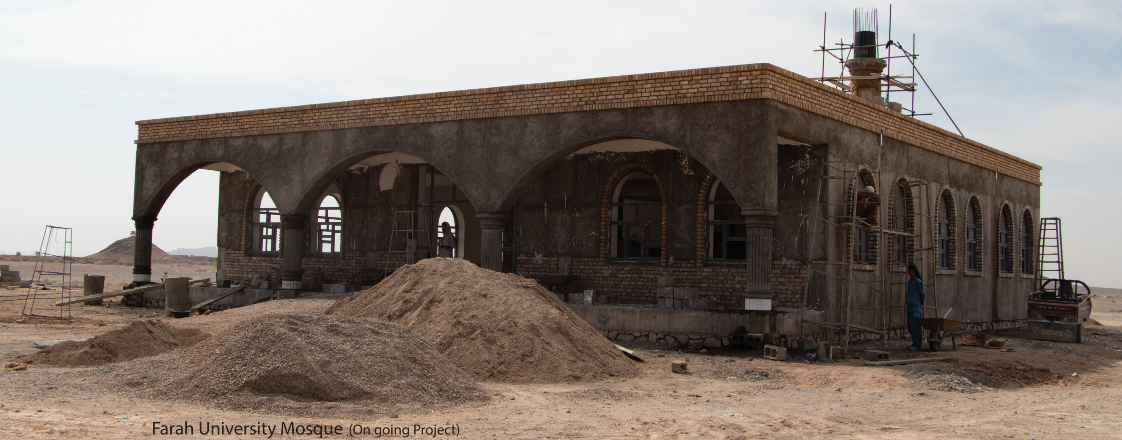
Farah University Mosque (On going Project)