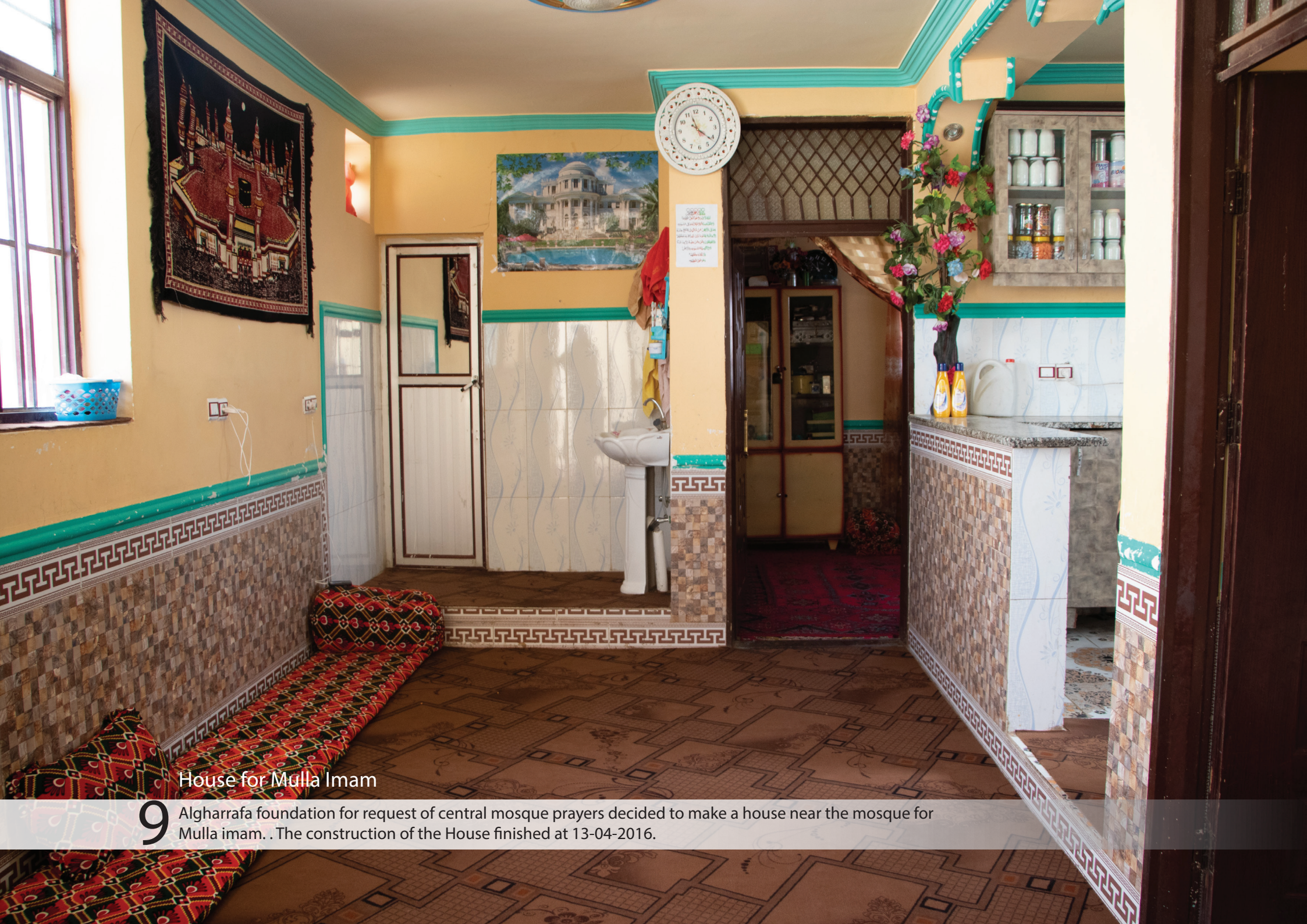
House for Mulla Imam

9 Algharrafa foundation for request of central mosque prayers decided to make a house near the mosque for Mulla imam. . The construction of the House finished at 13-04-2016.